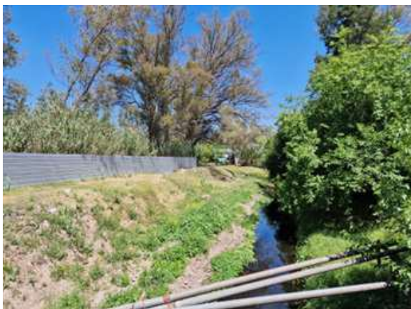
Figura 4 Puente Fernández. Tramo entre las calles La Plata y Entre Ríos de calidad regular según el índice.

Esto facilitaría que el vecino la reconociera como propia, se apropiara del lugar público, pudiera transitar o permanecer en actitudes contemplativas con lo cual se incrementaría en valor social. El menor valor es el tramo entre el Puente Entre Ríos y el Puente Los Andes (Figura 3), ribera muy sombreada por el avance de árboles exóticos de gran tamaño sobre una de sus márgenes y la línea de viviendas pertenecientes al barrio Cerrado Los Caracoles que invade la línea de ribera, combinación de circunstancias que deja crecer poca vegetación herbácea en los bordes.