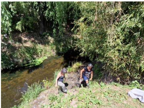
Figura 3 Puente Entre Ríos. Tramo de mala calidad según el índice.