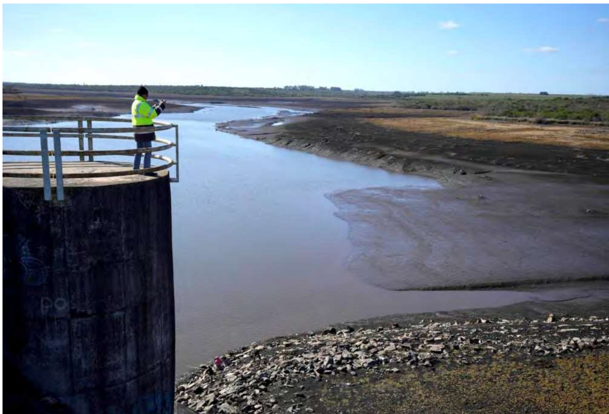
Figura 1. Bajos niveles de agua en el embalse Paso Severino, que abastece al 60% de la población uruguaya, el 1ero de julio. Una sequía sin precedentes ha provocado una crisis hídrica histórica en el país sudamericano. Falta de planificación deja sin agua a Uruguay frente a la crisis climática, https://dialogochino.net/es/author/luciacuberos/ , julio 11, 2023.

El Niño y la Niña son fenómenos climáticos existentes en ambos hemisferios y en el Océano Pacífico pero la diferencia fundamental es que el cambio climático ha aumentado sus efectos y sus consecuencias. El Niño y la Niña son fenómenos en las que las temperaturas del agua son más cálidas y más frías relativamente en el Océano Pacífico. El conjunto de ambos se conoce como la Oscilación del Sur y es la fuente más importante de variabilidad anual en el sistema climático global. En Uruguay sus efectos se sinergizan por culpa de los modelos de producción y consumo, pérdidas en cantidad y sobretodo en calidad del agua. Los proyectos que se proponen como respuestas no resuelven las necesidades, sino que empeorarían la situación, como se deduce de las falsas soluciones que se ofertan ahora, las que tienen más interés comercial y constructivo que social y técnico. Son propuestas que generaron conflictos en curso con la sociedad, sobretodo con la que está más informada de las situaciones globales que se viven después de la confluencia de crisis de pandemia, desglobalización, conflicto geopolítico hegemonía con multipolaridad, cambio climático y manejo de los límites del planeta para ser sustentables.