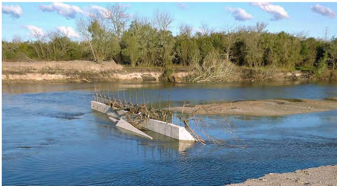
Figura 3. Dique en Paso Belastiquí, una de las medidas de emergencia del gobierno, destruido por las aguas del río Santa Lucía. 25 de agosto de 2023. Enrique Gudynas, Brecha 1 septiembre, 2023

El manejo de la crisis hídrica agropecuaria como la de la subsiguiente crisis del agua potable fue malo [5] ya que en el agro sólo se plantearon medidas puramente financieras y de mayores plazos para pagar y no se lanzaron programas de fuentes alternativas como podrían ser pozos de agua subterránea. En cuanto al agua potable se confiaron en que hubiera lluvias a pesar de los pronósticos meteorológicos adversos. Se continuó cobrando el agua de red como si fuera dulce cuando ya era salada; no hubo rebajas y a lo sumo no se cobraron algunos impuestos como el del valor agregado. No se tuvo en cuenta la población de bajos recursos que no podrían afrontar la compra de agua envasada.